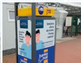
Fabryka VW, Swarzędz