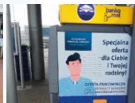
Fabryka VW, Września